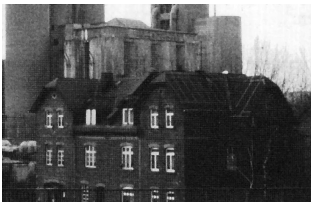
Wetzlarer Gewerkschaftshaus des DMV an der Überführung

Im Einwohnerbuch Wetzlars, das im Juni 1933 erschien, wurde der ADGB mit keinem Wort mehr erwähnt, was die Jahre zuvor stets der Fall war. Untermauert wird damit die lange und penible administrative Planung der Gewerkschaftsbekämpfung. Das Gewerkschaftshaus der Metallarbeiterverbandes (DMV) samt dem ADGB-Büro in der Überführung 1-3 (heute: Niedergirmeser Weg) musste während der Reichstagswahlen am 5. März bewacht werden. Die Angst vor Übergriffen durch SS und SA war zu groß. Trotzdem kam es nach der Wahl zu Plünderungen und Sachbeschädigungen des Hauses. Am 2. Mai okkupierten schließlich die zuständigen NSDAP-Kreis- und Ortsgruppenleiter die Gewerkschaftshäuser im Deutschen Reich – so auch in Wetzlar. Fortan richtete die der NSDAP unterstellte DAF ihr Büro im Gewerkschaftshaus Wetzlar ein.